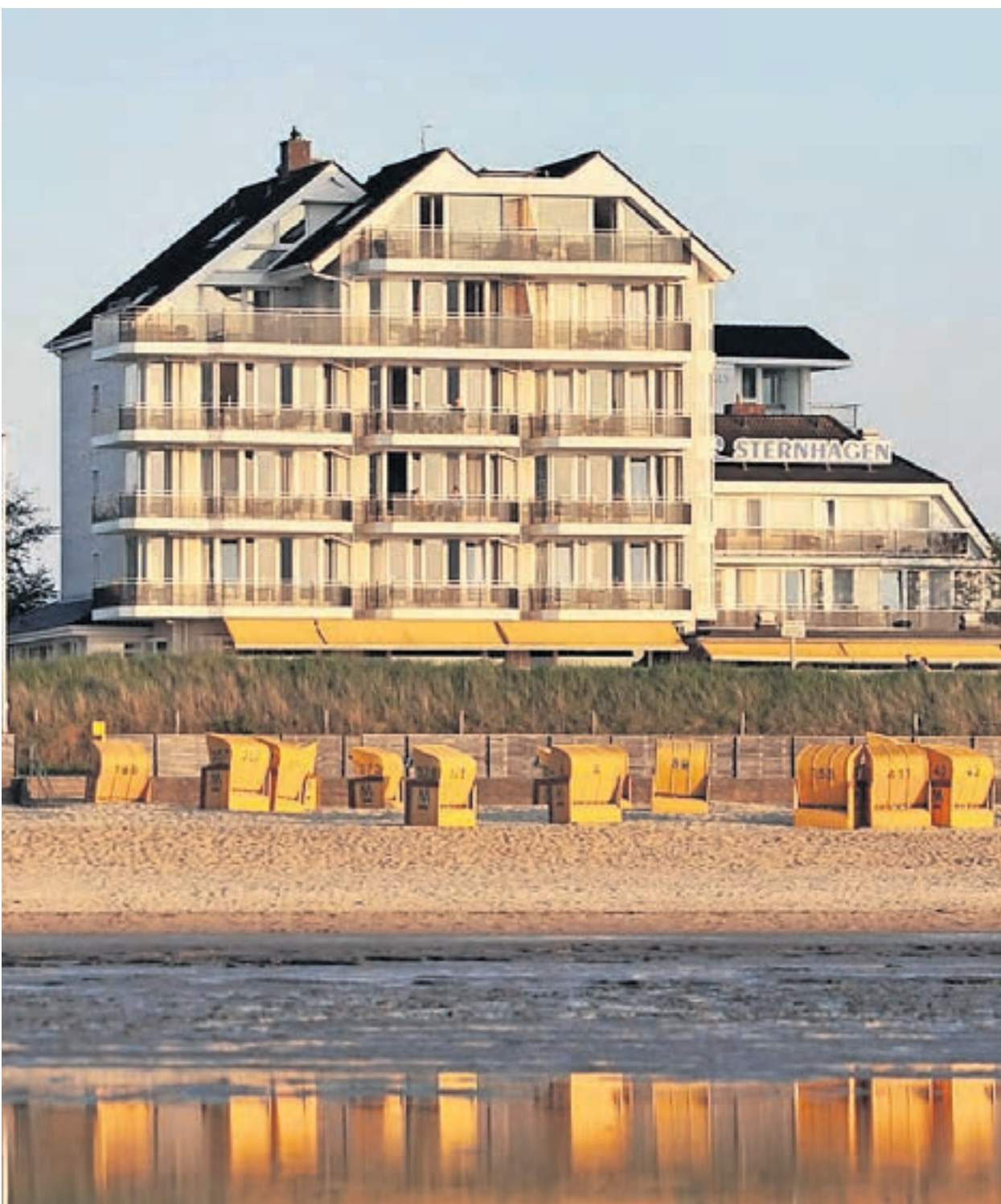
Das Badhotel Sternhagen gehört zu den ersten Adressen in Deutschland. Im Restaurant „Sterneck“ bietet es auch eine Sterne-Küche.

Wohlsenstraße 48 a 27478 Cuxhaven Tel. 047 23 - 5004 007 Alarmanlagen-Cuxhaven.de