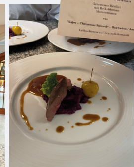
Riechen, schmecken, genießen stehen hier auf dem Programm